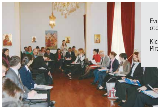
Εναρκτήρια συνάντηση στον Πειραιά Kick Off meeting in Piraeus