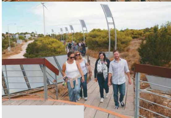
Εκπαιδευτική επίσκεψη στο Πάρκο Ενεργειακής Αγωγής (ΠΕΝΑ) Study visit in the Park of Energy Awareness (PENA)