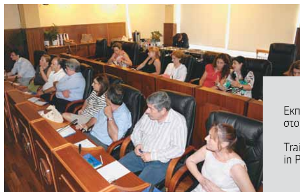
Εκπαίδευση στο Δήμο Πειραιά Training workshop in Piraeus