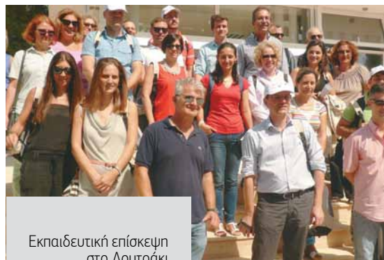
Εκπαιδευτική επίσκεψη στο Λουτράκι Study visit in Loutraki