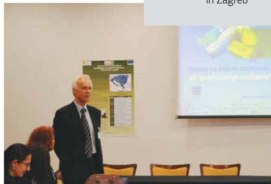
Συνάντηση εταίρων στο Zagreb Partner meeting in Zagreb